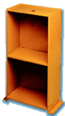
MS mobiletto di supporto support cabinet